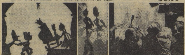
В Московском театре теней оживают волшебные сказки разных народов и стран. Посмотри на сценки: это сцены из спектакля «Конек-горбунок» — танные, какими их видит зритель и сами актёры.