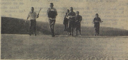
По барханам, причёсанным ветром, отправились туркменские пионеры с весёлым концертом в соседний аул. Живут ребята в Центральном Каракумах, в посёлке Бахардон.